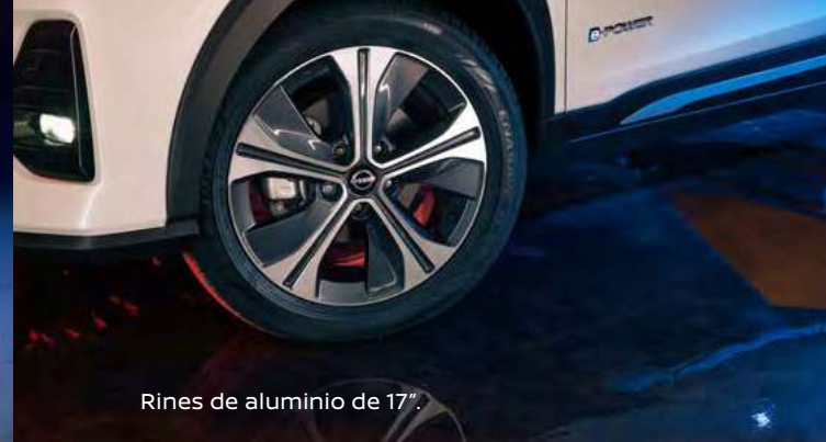
Rines de aluminio de 17".

El diseño exterior de Nissan Kicks Play e-POWER sumará un toque vanguardista y audaz a tu estilo. Enamórate del todo y también de sus detalles: rines de aluminio de 17", emblema exclusivo e-POWER y alerón trasero que le da un toque sofisticado y deportivo al vehículo.