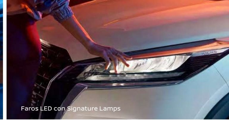
Faros LED con Signature Lamps