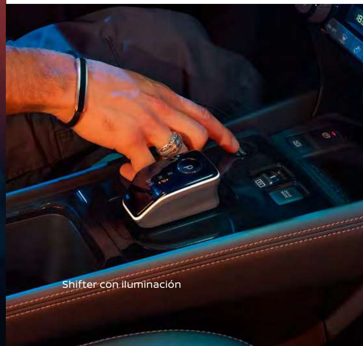
Shifter con iluminación