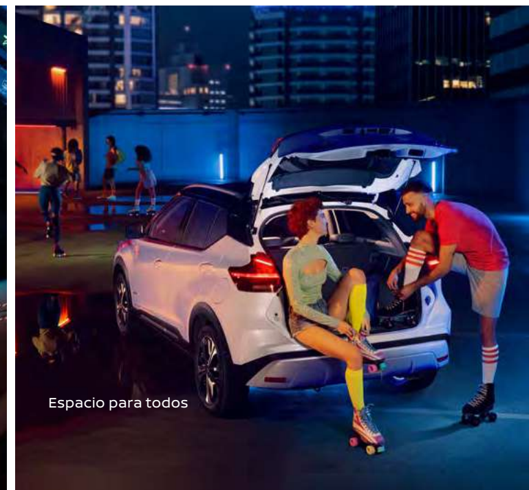
Espacio para todos