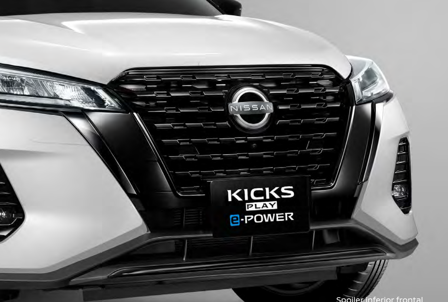
Spoiler inferior frontal

Prepárate para alcanzar un nivel electrizante de personalización con la línea de accesorios diseñada para Nissan Kicks e-POWER.