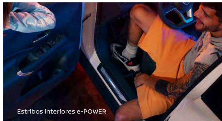
Estribos interiores e-POWER